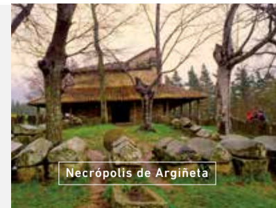
Necrópolis de Argiñeta

Ya en Elorrio nos dejaremos sorprender por el alto valor de su patrimonio histórico, palacios y casas solariegas de contundente piedra y sillería labrada, el Monasterio de Santa Ana, la basílica de la Purísima Concepción, la puerta de Don Tello, el palacio