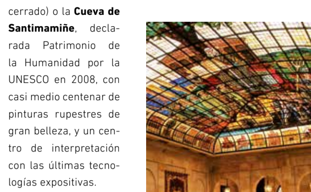
Casa de Juntas de Gernika

Después de recorrer el mercado de Gernika (el lunes) o comer un buen plato de sus famosas alubias o pimientos, y tras visitar el importante y simbólico patrimonio de esta villa, partimos hacia Kortezubi para descubrir el Bosque de Oma (ahora cerrado) o la Cueva de Santamiñe , declarada Patrimonio de la Humanidad por la UNESCO en 2008, con casi medio centenar de pinturas rupestres de gran belleza, y un centro de interpretación con las últimas tecnologías expositivas.