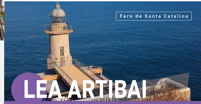
Faro de Santa Catalina

BODEGA ARRITXOLA, BODEGA ETXERRIAGA, BODEGA MENDRACA