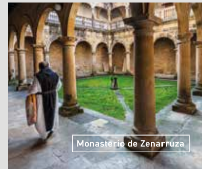
Monasterio de Zenarruza

En el interior nos espera Markina-Xemein , localidad enmarcada dentro del Camino de Santiago del Norte. Sus palacios renacentistas y barrocos muestran su pasado esplendoroso. A unos 4 kilómetros se encuentra La Colegiata de Ziortza o Monasterio de Zenarruza . Un importante monumento histórico-artístico de la ruta jacobea del norte en el que destaca su claustro de estilo plateresco, único en Bizkaia.