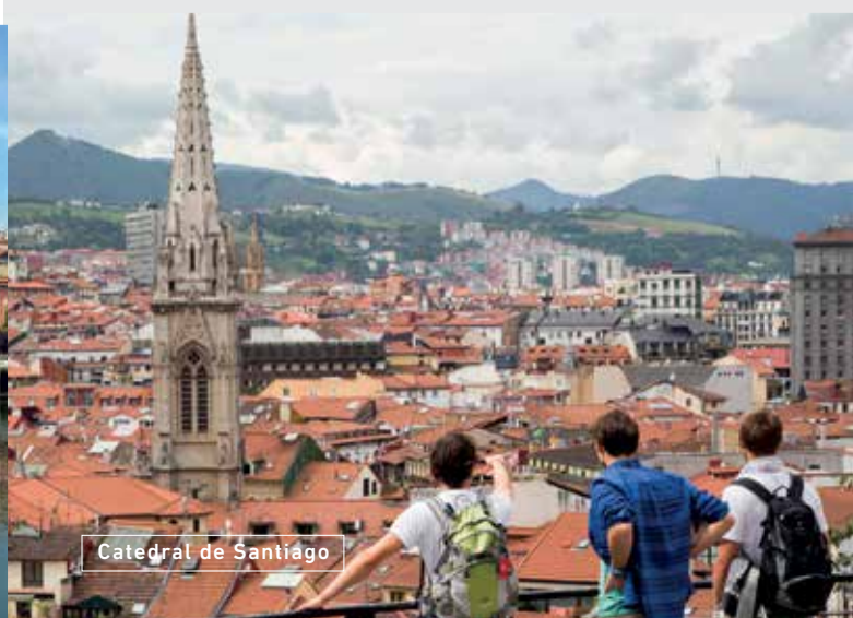
Catedral de Santiago

EUSKADI BASQUE COUNTRY #Basqueexperience