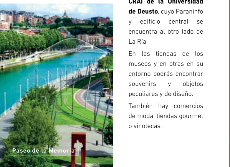
Paseo de la Memoria