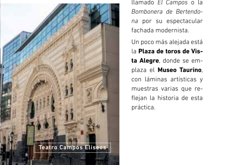
Teatro Campos Eliseos