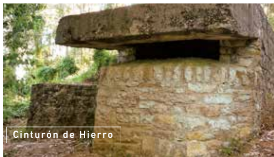
Cinturón de Hierro

Si eres amante de la bicicleta, recorrer la Ruta del Bosque de Oma (R03), disfrutando de la obra pictórica más importante de Agustín Ibarrola, siempre es una decisión acertada. Seguirás el trazado de 23 kilómetros a lo largo de verdes valles, calzadas históricas y bosques autóctonos; una auténtica aventura.