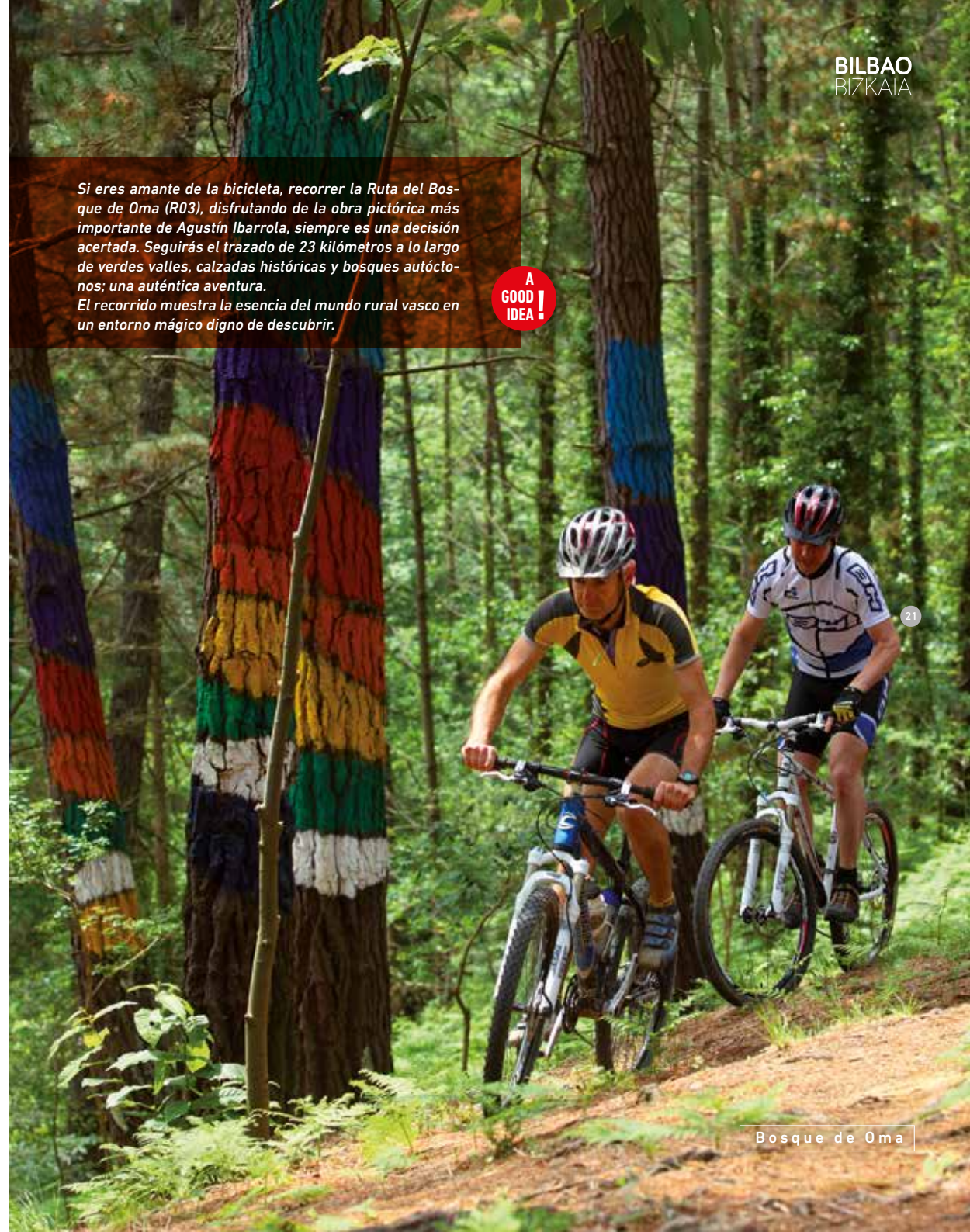
Bosque de Oma