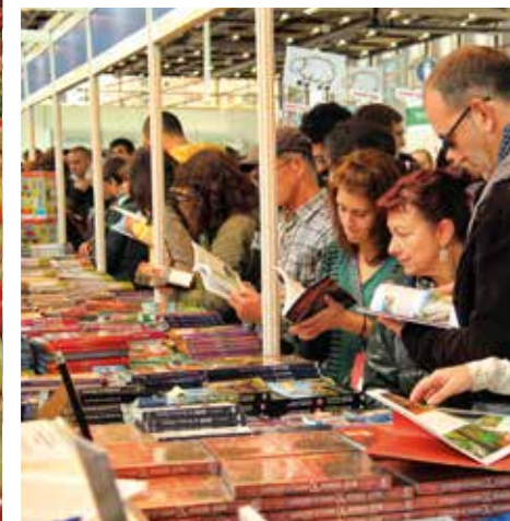
Feria del Libro y Disco Vascos

Si te gusta el pescado estás en el lugar ideal... porque te encuentras en una tierra que tiene el privilegio de contar con numerosos puertos que ofrecen a diario los productos frescos de nuestros arrantzales (pescadores). Un placer que puedes maridar con el txakoli , cuyo día especial - Txakoli Eguna -celebran en diversas ferias localidades como Gernika-Lumo, Zalla, Gorliz y Lezama.