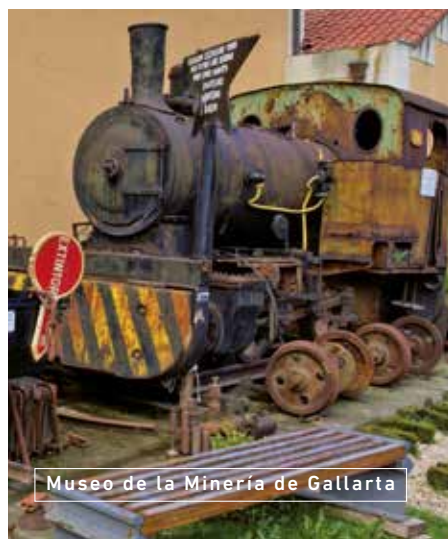
Museo de la Minería de Gallarta

6 S eguir las huellas de un pueblo con una personalidad tan marcada es apasionante. Para ello, nada mejor que "perderte" en el Museo de la Paz , en Gernika-Lumo, que gira en torno al bombardeo que sufrió la villa durante la Guerra Civil, aspira a ser un punto de encuentro de todos en torno a la paz. El Museo de la Minería del País Vasco , en Gallarta, el de Arte e Historia de Durango, el de Simón Bolívar en Ziortza-Bolibar, que muestra la vida del pueblo vizcaíno en la Edad Media... todos contribuyen a dar forma al mapa que configura la vida y peculiaridades de sus gentes. Includo el Museo de Bellas Artes de Bilbao, que a través de las obras de numerosos artistas vascos, refleja a la perfección el alma de este pueblo.