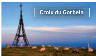
Croix du Gorbeia

Cette localité est le point de départ de nombreux itinéraires de différentes durées et difficultés pour accéder au Parc naturel de Gorbeia, tels que ceux d'Usabel et de Belaustegi. Orozko possède également un important patrimoine architectural. En termes de constructions religieuses, il faut souligner les églises paroissiales de San Bartolomé de Olarte, de San Pedro de Murueta et de San Lorenzo de Urigoiti, ainsi que la