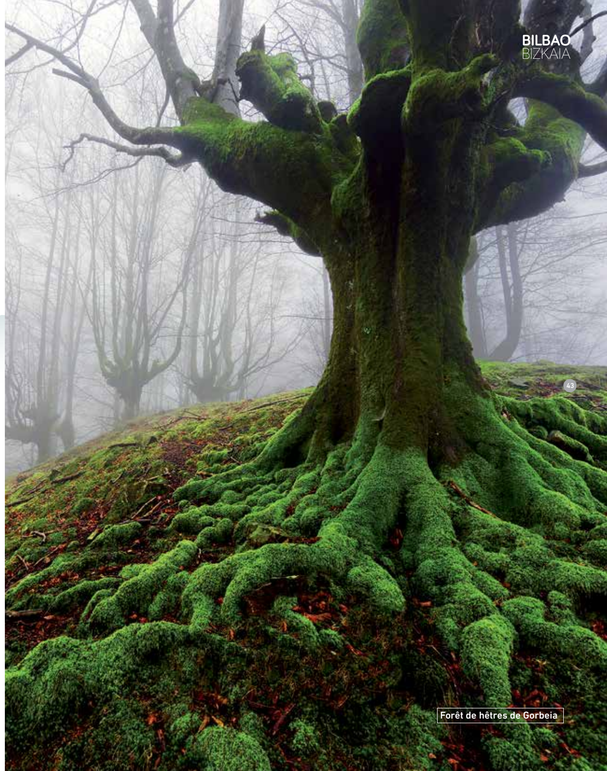
Forêt de hêtres de Gorbeia

Le Bizkaibus A3613 nous ramènera à Bilbao.