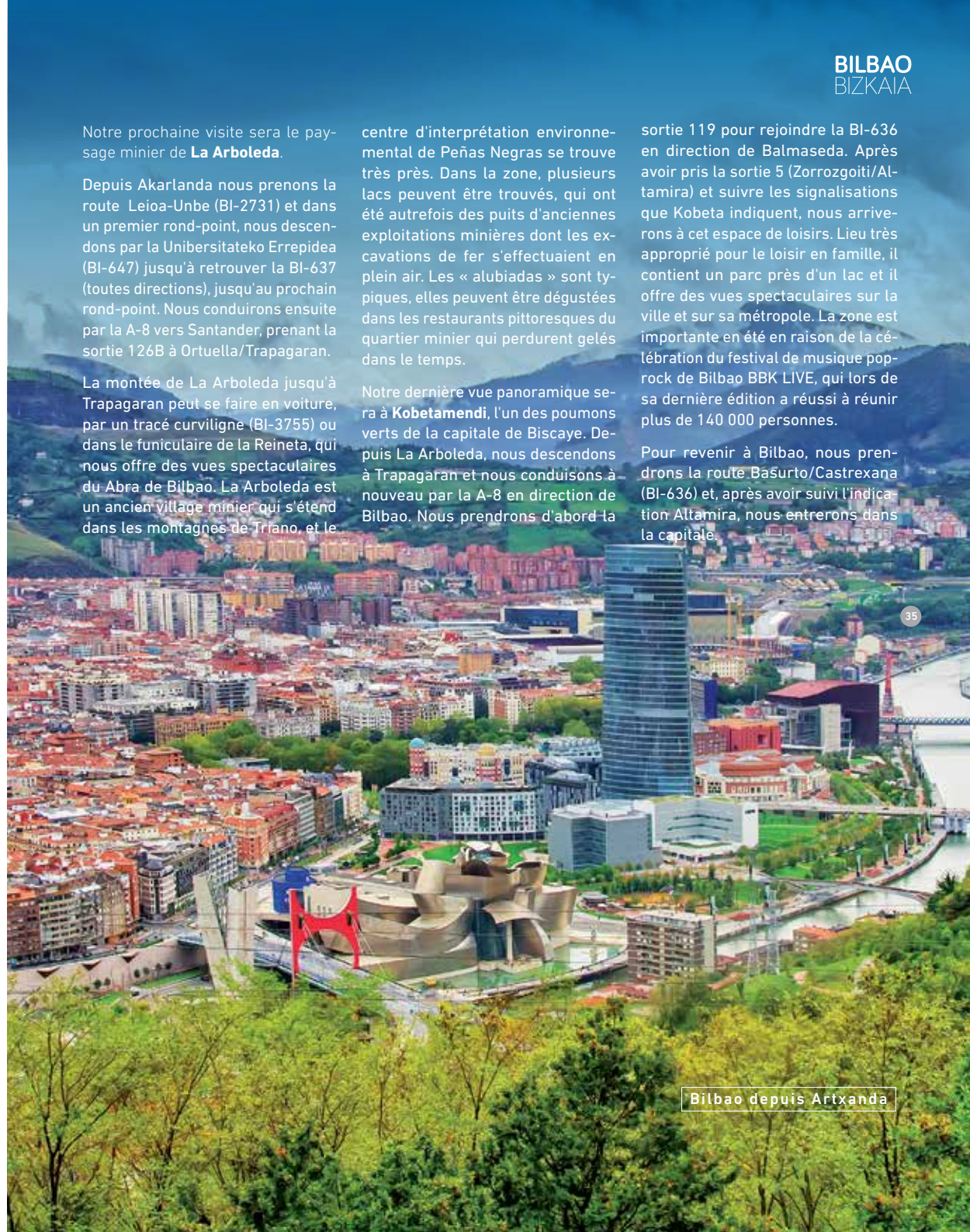
Bilbao depuis Artxanda

Pour revenir à Bilbao, nous prendrons la route BaSurto/Castrexana (BI-636) et, après avoir suivi l'indication Altamira, nous entrerons dans la capitale.