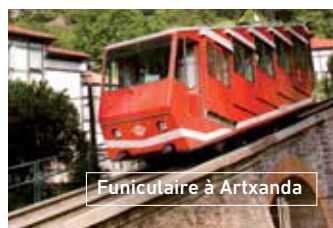
Funiculaire à Artxanda

34 choisir deux façons de monter, le funiculaire ou la voiture. La montée la plus attrayante est dans le funiculaire de Artxanda, qui communique Bilbao avec le sommet depuis 1915. Le trajet ne dure pas plus de 3 minutes et vous pouvez le prendre à place del Funicular (rue Castaños).