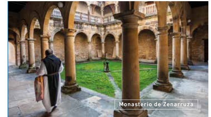
Monasterio de Zenarruza

Para volver a Bilbao, retomaremos la BI-633 en dirección Durango. Allí, tomaremos la autopista AP-8 hacia Bilbao.