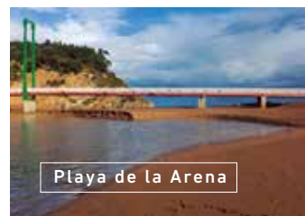
Playa de la Arena

Seguimos ruta por la BI-3794 hacia el pueblo de Zierbena , un pequeño