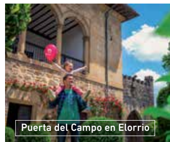
Puerta del Campo en Elorrio

Además es interesante conocer la fuente loca o Iturrizoro, el frontón, recorrer los 9 cruceros y descubrir los numerosos escudos heráldicos que cuelgan de las fachadas. No en vano, Elorrio es la villa de Bizkaia con mayor número de cruceros (destaca la Cruz de Kurutzia) y de escudos heráldicos. En sus calles os encontraréis con Errebonbilloa, una estatua de bronce que representa a los soldados de la localidad que participaron en la batalla de Lepanto. Una visita indispensable es la Necrópolis de Argiñeta, uno de los monumentos funerarios más importantes de Euskadi.