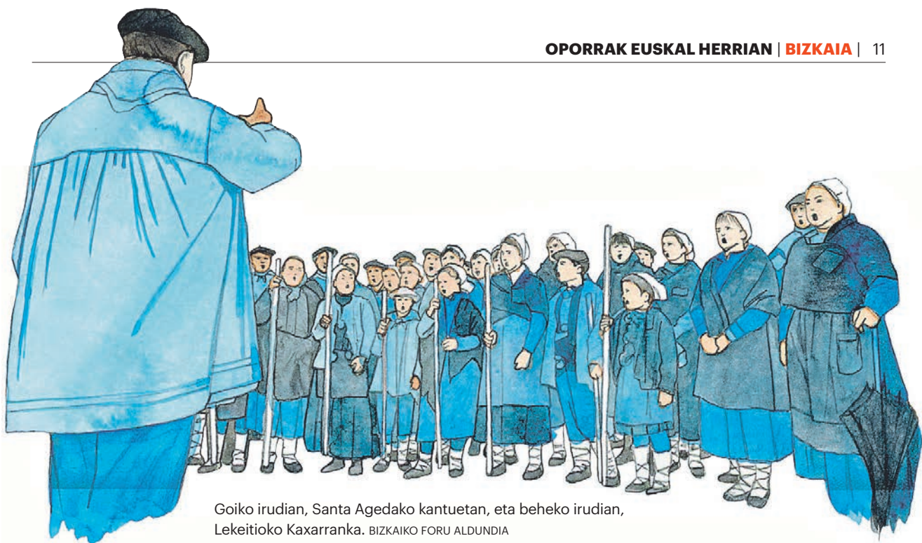
Goiko irudian, Santa Agedako kantuetan, eta beheko irudian, Lekeitioko Kaxarranka. BIZKAIKO FORU ALDUNDIA

txoko bakoitzaren nortasuna islatzeko eta aldarrikatzeko aukera izango da.