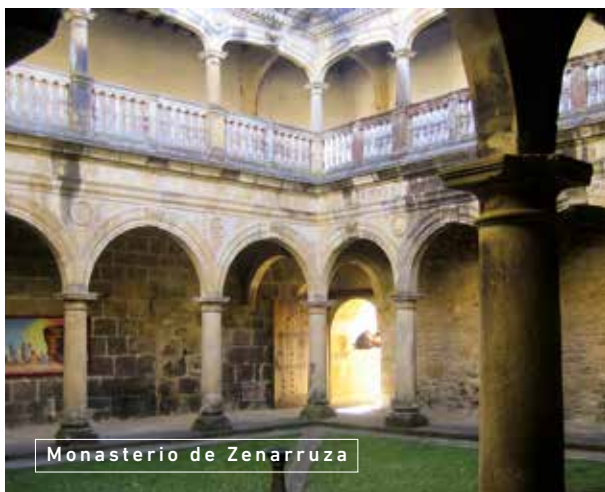
Monasterio de Zenarruza

Todos los caminos a Santiago tenían su razón de ser. El Camino que atraviesa Bizkaia, o Camino del Norte, era frecuentado ya en la Baja Edad Media por peregrinos que pretendían evitar la amenaza musulmana que se cernía sobre Navarra, y por navegantes de toda Europa que desembarcaban en los puertos pesqueros y comerciales del Cantábrico.