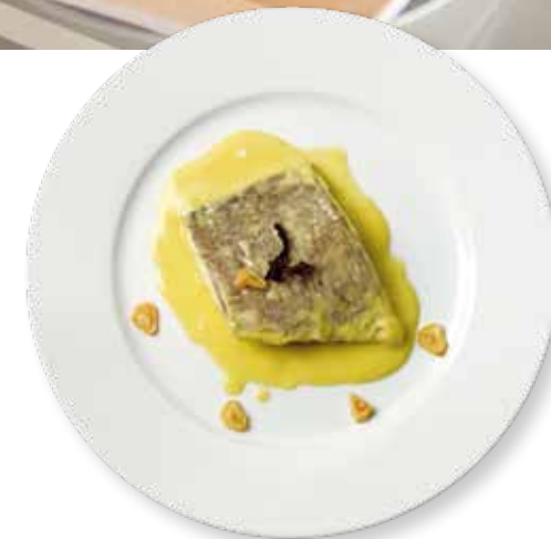
Bacalao al pil-pil