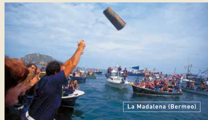
La Madalena (Bermeo)

También en Lekeitio, las fiestas del Kilin Kala demandan una buena costera del bonito. Y el baile de la Kaxarranka o Fiesta del Arca , que se remonta al siglo XV, conmemora a ritmo de txistu, tamboril y atabal, la elección de dos mayordomos por los miembros de la Cofradía de Pescadores, para recoger y guardar los beneficios del año en un arca.