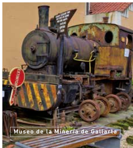
Museo de la Minería de Gallarta

Una de las mejores maneras de acceder a la identidad vasca es a través del Euskal Museoa Bilbao Museo Vasco y para conocer la historia marinera de este pueblo lo mejor y muy interesante es visitar el Itsasmusium en la orilla de la Ría.