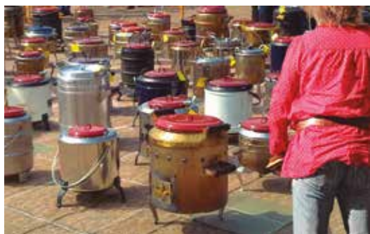
Putxera en Balmaseda

Seguro que una de las razones que te han traído aquí es su famosa gastronomía ¿Qué tal si ahora invertimos un rato en conocer los trucos de esa figura experta que ha evolucionado hasta convertir en arte cualquier plato? Existen talleres que te acercan a las recetas más codiciadas impartidos por profesionales de nivel, donde además de compartir su "saber hacer" conocerás por qué se encuentran entre los mejores. Incluso podrás conversar directamente con el chef y participar eligiendo los productos en el mercado. En un ambiente ameno descubrirás la pasión y el cariño que rodea a la buena cocina, aprendiendo a preparar los platos vascos más renombrados. Estos cursos magistrales incluyen show cookings, catas, maridajes... Y si te interesa algo en concreto, puedes contratar una experiencia gastronómica personalizada... así luego podrás preparar en casa ese plato tan especial.