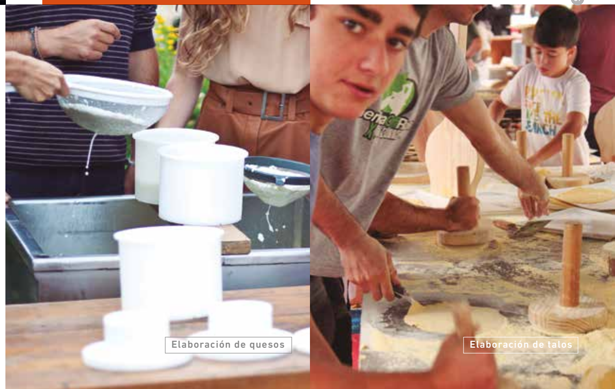
Elaboración de quesos