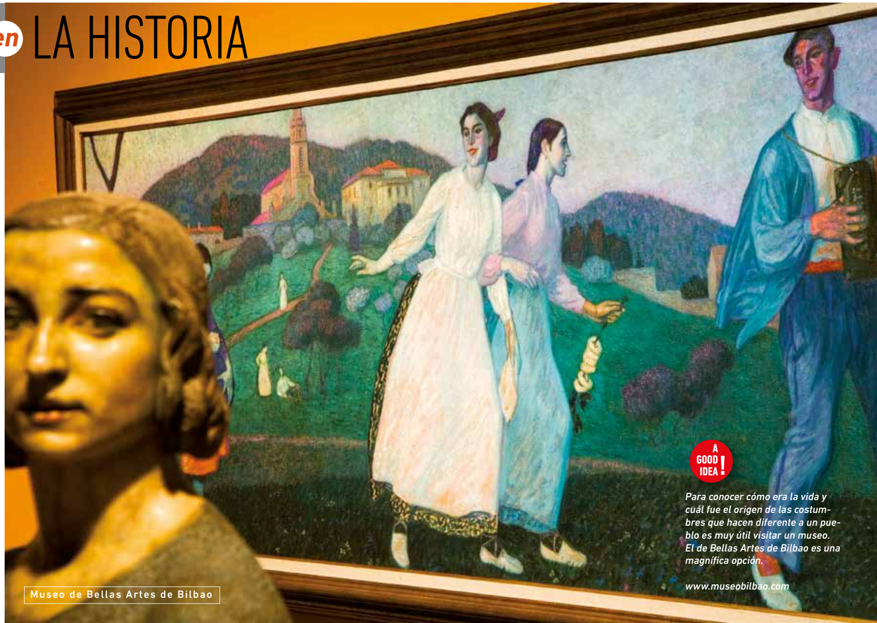
Museo de Bellas Artes de Bilbao