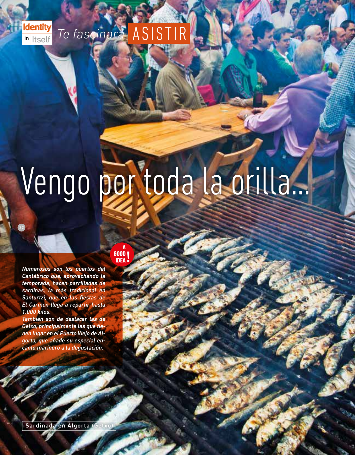
Sardinada en Algorta (Getxo)

En Bizkaia abundan las procesiones marineras que homenajean a la patrona de los arrantzales (marineros), la Virgen del Carmen