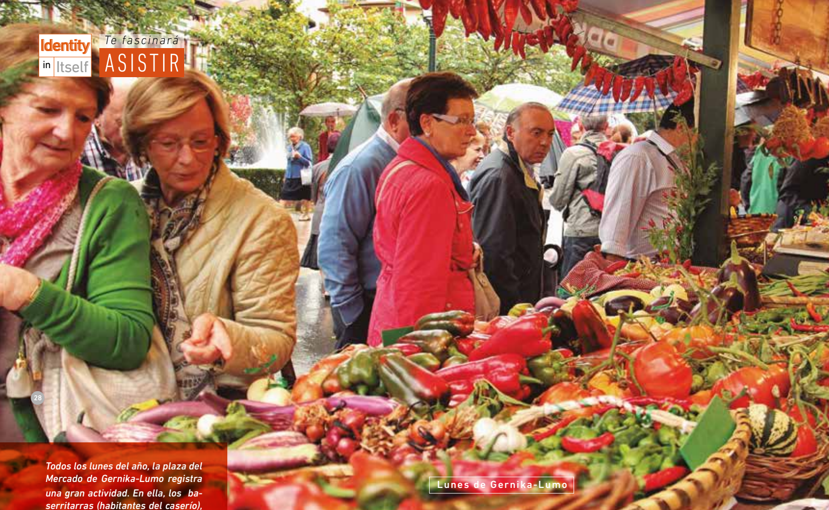
Lunes de Gernika-Lumo

Todos los lunes del año, la plaza del Mercado de Gernika-Lumo registra una gran actividad. En ella, los baserritarras (habitantes del caserío), ofrecen lo mejor de sus huertas y de sus corrales en un intercambio comercial y social pleno de color y sabor. Los primeros sábados se organiza un especial monográfico, destacando el día del queso Idiazabal y el txakoli de Urdaibai, el mes de junio. Con más de 350 puestos, este mercado muestra que ciertas tradiciones siguen aún vigentes.