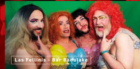
Las Fellinis - Bar Badulake

La zona de ocio nocturno LGBTI+ de Bilbao se sitúa en el Casco Viejo y Bilbao La Vieja (a uno y otro lado de la Ría). Algunos de los locales que encontrarás por aquí son el Badulake, Pub Key, Pub Modesto, Balcón de la Lola, bar High, Lamiak, bar Manolita la primera, los bares de zona del Hiruki y Marzana y el Lambda en Barakaldo.