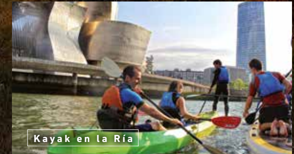
Kayak en la Ría

Si te gusta la playa, ni dudarlo, tienes de todo para elegir, las de gran belleza paisajística como Laida , Laga o Gorliz o nudistas y frecuentadas por un público mayoritariamente LGBTI como Meñakoz , Barinatxe , Azkorri o Barrika .