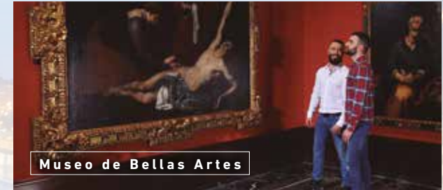
Museo de Bellas Artes

Quando vengas a Bilbao tienes ya una cita asegurada. Una cita con la cultura expresada en un gran número de eventos y de espacios. El imprescindible Museo Guggenheim Bilbao , icono que hoy define la ciudad o el Museo de Bellas Artes , todo un catálogo que repasa la historia del arte, te esperan.