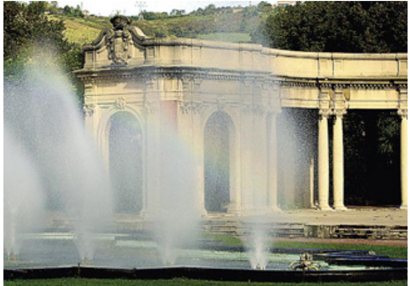
23. orrialdea, goian: Campos Antzokiaren xehetasuna. Frantziako eragina hemen ere ageri da, fatxadako estukozko apaingarrietan.